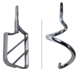
Utensili in dotazione/ Equipped with utensil

RISPONDENTI A TUTTE LE NORME DI IGIENE E SICUREZZA VIGENTI NEL MONDO